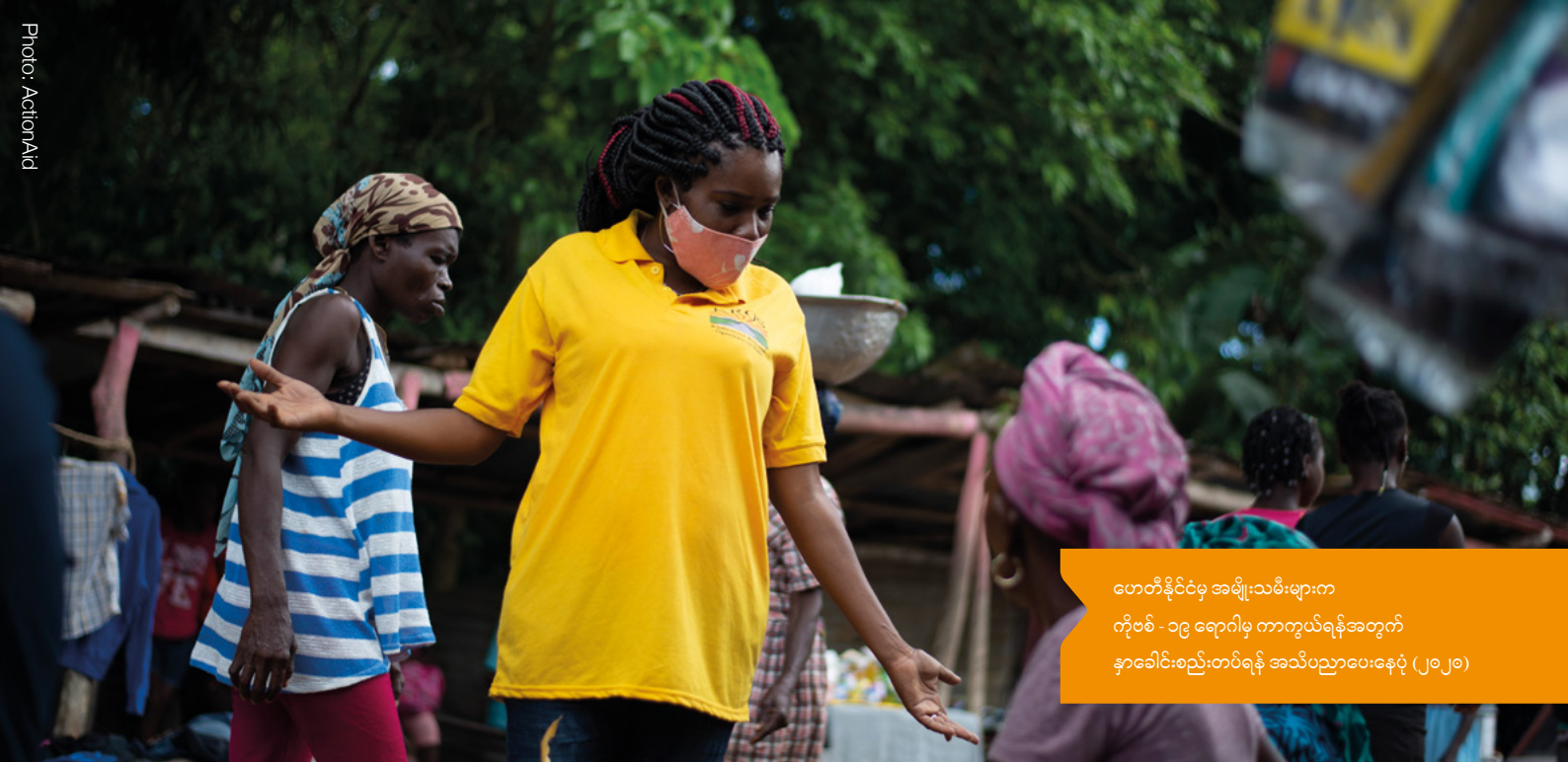
ဟေတီနိုင်ငံမှ အမျိုးသမီးများက ကိုဗစ် - ၁၉ ရောဂါမှ ကာကွယ်ရန်အတွက် နှာခေါင်းစည်းတပ်ရန် အသိပညာပေးနေပုံ (၂၀၂၀)