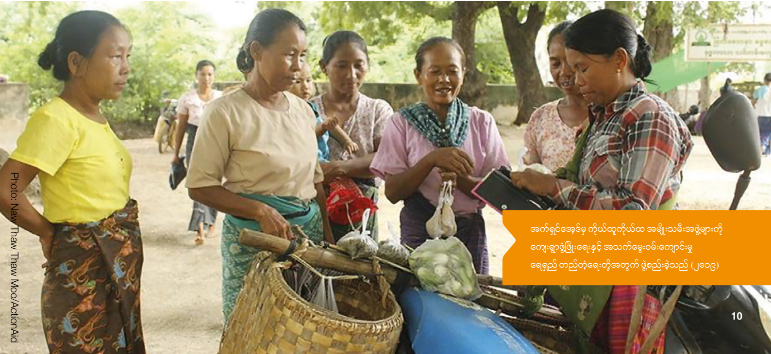
အက်ရှင်အေဒီမှ ကိုယ်ထုကိုယ်ထ အမျိုးသမီးအဖွဲ့များကို ကျေးဇူးဖွံ့ဖြိုးရေးနှင့် အသက်မွေးဝမ်းကျောင်းမှ ရေရှည် တည်တံ့ရေးတို့အတွက် ဖွဲ့စည်းခဲ့သည် (၂၀၁၉)

ဤသုတေသနတွင် တွေ့ရှိချက်များရ နိုင်ငံတစ်ခုချင်းစီတွင်ရှိသည့် လူ့အဖွဲ့အစည်းအတွင်းမှ တံဆိပ်ကပ်ခြင်းများနှင့် ဖိုဝါဒကြီးစိုးမှု သဘောထားများက အမျိုးသမီးများ နှင့် အမျိုးသမီးငယ်များအား ပဋိပက္ခများအတွင်း ပို၍ ထိခိုက်လွယ်သူများဖြစ်စေရန် တွန်းဖို့လျက်ရှိပြီး၊ ထိုအကြောင်းကြားရာများမှ အမျိုးသမီးများနှင့် အမျိုးသမီးငယ်များ၏ အခွင့်အရေးများအား နားမလည်စေကာ၊ အမျိုးသားများနှင့် အမျိုးသားငယ်များ၏ အဆင့်အတန်း၊ လိုအပ်ချက်များကိုသာ လူမှု အသိုက်အဝန်းအတွင်း ဦးစားပေးသည့် လူမှုစံနှုန်းများအား လက်ခံစေရန် တွန်းအားပေးလျက်ရှိသည်။ သုတေသနတွင် ပါဝင်သူများ၏ ထွက်ဆိုချက်များအရ လက်ဘနွန်နိုင်ငံတွင်